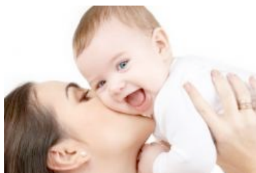
Il tasso di natalità in Italia negli ultimi anni è drasticamente diminuito