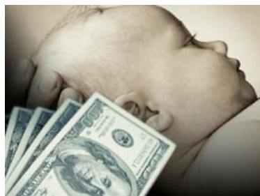
Quanto costa un bimbo?