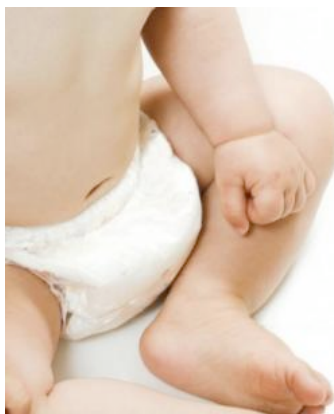
Con i pannolini lavabili si riduce notevolmente l'incidenza di irritazioni

Volendo quantificare, il risparmio per chi non utilizza gli usa e getta si aggira intorno a 1.500 euro. A ciò si aggiunge il fatto che i pannolini di stoffa possono essere riutilizzati per ogni figlio (a differenza degli usa e getta) e, infine, regalati ad altre mamme della cerchia familiare o destinati al bebè di un'amica.