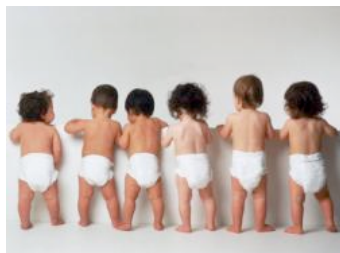
Alcuni genitori hanno alternato soluzioni diverse: usa e getta fuori casa e lavabili in casa

Insomma, non resta che provare, valutare, cercare la soluzione più adatta al proprio bimbo e alla propria realtà.