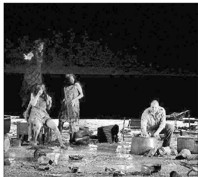
Un momento del "Crepuscolo degli dei" in scena alla Fenice

menica 28 giugno alle 15.30 (turno B), mercoledì 1 luglio alle 18 (turno E), sabato 4 alle 15.30 (turno C) e martedì 7 alle 18 (turno D). Come nel finale di "Siegfried", anche nella "Götterdämmerung" Wagner dà prova di una vertiginosa abilità nella sovrapposizione e nell'addensamento dei temi. Nel contempo vi ricompaiono anche episodi corali e forme chiuse di taglio operistico tradizionale, come il duetto tra Siegfried e Brünnhilde alla fine del prologo o il terzetto fra Brünnhilde, Gunther e Hagen alla fine dell'atto secondo.