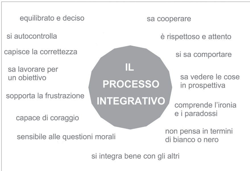
Figura I.4 Tratta dal corso Neufeld Intensive I: Making Sense of Kids

Una delle più importanti conseguenze evolutive del processo integrativo è la capacità di essere un'individualità separata in mezzo a tante altre persone. Quando si è in grado di restare fedeli al proprio punto di vista pur considerando le esperienze dell'altro, si guadagnano vedute più ampie e profonde.