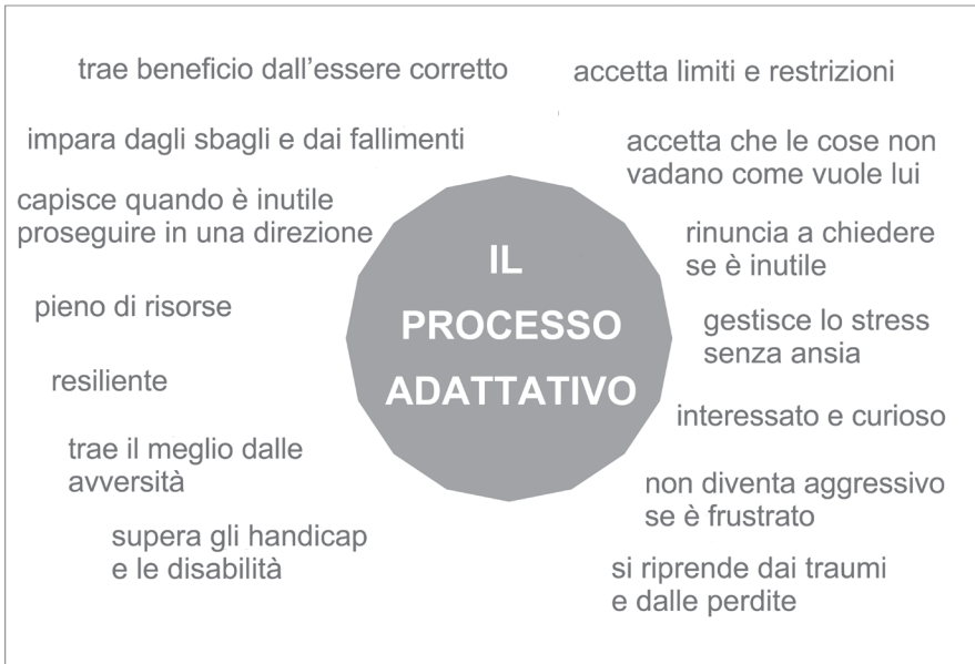
Figura I.3 Tratta dal corso Neufeld Intensive I: Making Sense of Kids

Il secondo processo di maturazione che sottende allo sviluppo del potenziale umano è il processo adattativo . È alla radice del modo in cui si diventa resilienti e pieni di risorse, e di come ci si riprende dalle avversità. Non si può insegnare a un bambino ad adattarsi, è un processo che senza le giuste condizioni non può avvenire.