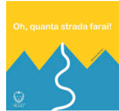
Oh, quanta strada farai! , Jérôme Ruillier, Il leone verde piccoli, 2025. Da 9 mesi (per l'esperienza tattile), da 3 anni (per il contenuto).

Il libro segue passo passo i mesi di gravidanza e narra in forma poetica i tanti momenti che riempiono il tempo dell'attesa: il primo battito, il senso di protezione, la pazienza, la meraviglia, e poi il travaglio, il parto, la nascita. È una sorta di diario da leggere mese dopo mese. Le illustrazioni di Sonia Maria Luce Possentini incantano raffigurando dettagli (un nido, un volto sfumato, una figura appena delineata) che emergono da magnifici sfondi – paesaggi chiari, ampi orizzonti o cieli notturni – e visivamente trasmettono le emozioni, i sentimenti di questo periodo unico, così particolare.