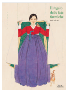
Il regalo delle fate formiche , Shin Sun-Mi, Topipittori, 2024. Per mamme e nonne; per bambini dai 6 anni.