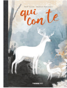
Qui con te , M. H. Clark, Isabelle Arsenault, Terre di mezzo, 2021. Per genitori; per bambini dai 3 anni.

Il testo inizia e si conclude con “Ecco la chiave di casa”, che subito ricorda, ai bimbi di lingua inglese, la filastrocca This is the Key of the Kingdom : “This