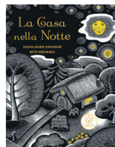
La casa nella notte , Susan Marie Swanson, Beth Krommes, Il leone verde piccoli, 2025. Da 2 anni.